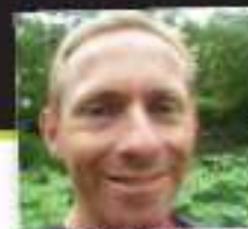
Mado de Charente 37 ans abbaye, troupe les filles...