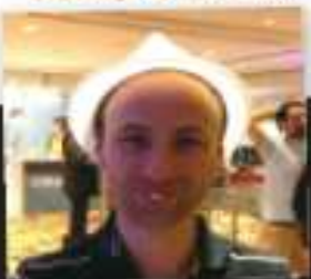
Armor cup, 16 ans de passion